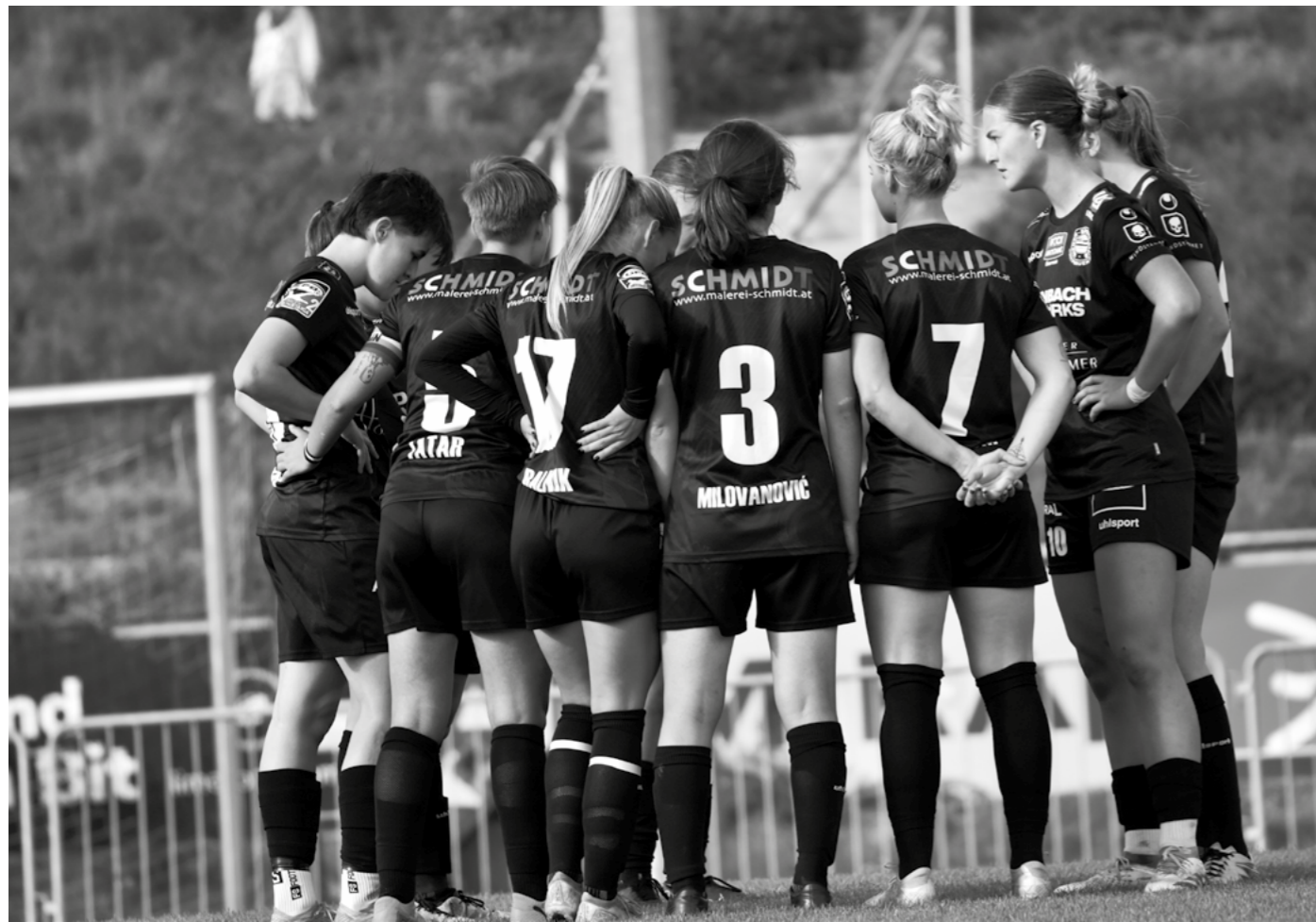
Text Christian Hettlerich