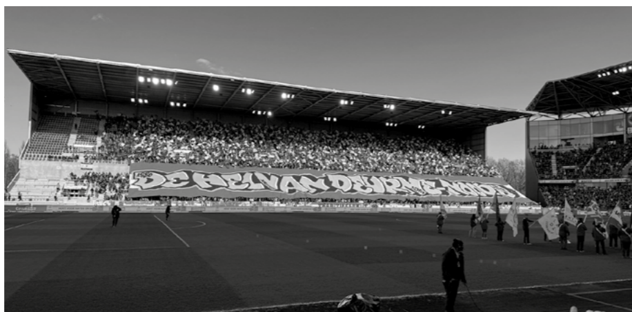
Tag 3: Royal Antwerp vs. Standard de Liège 1:1 – Kurvensupport von der Gegengerade

Text Martin Unterthaler