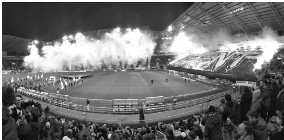
Tag 1: KAA Gent vs. Zulte Waregem 2:0 – Start der Verspätungstour

Tag 4. Letzter Tag in Belgien. Brüssel anschauen. Eh okay. Maison Antoine. Waffeln essen. Zurück in die Unterkunft. Sachen holen. Auf zum Bahnhof. Zugausfall. ICE nach Köln. 3 Stunden. Ab nach München. Ab nach Salzburg. Ab nach Wien. Ab in die Erinnerungskiste.