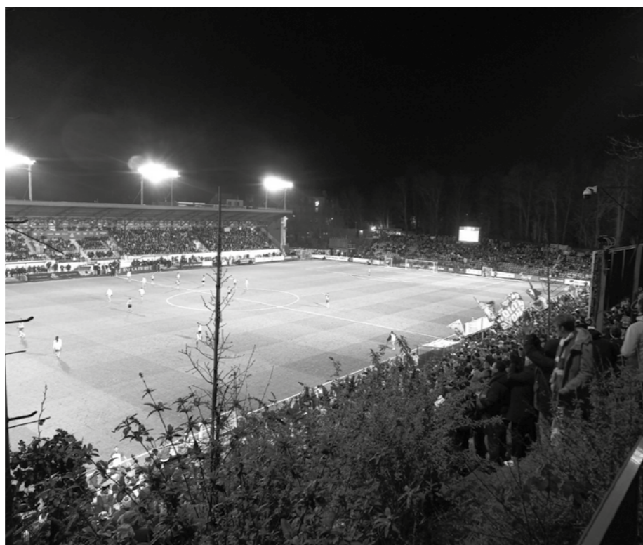
Tag 2: Royale Union Saint-Gilloise vs. FCV Dender EH 2:0 – Die Hohe Warte Belgiens